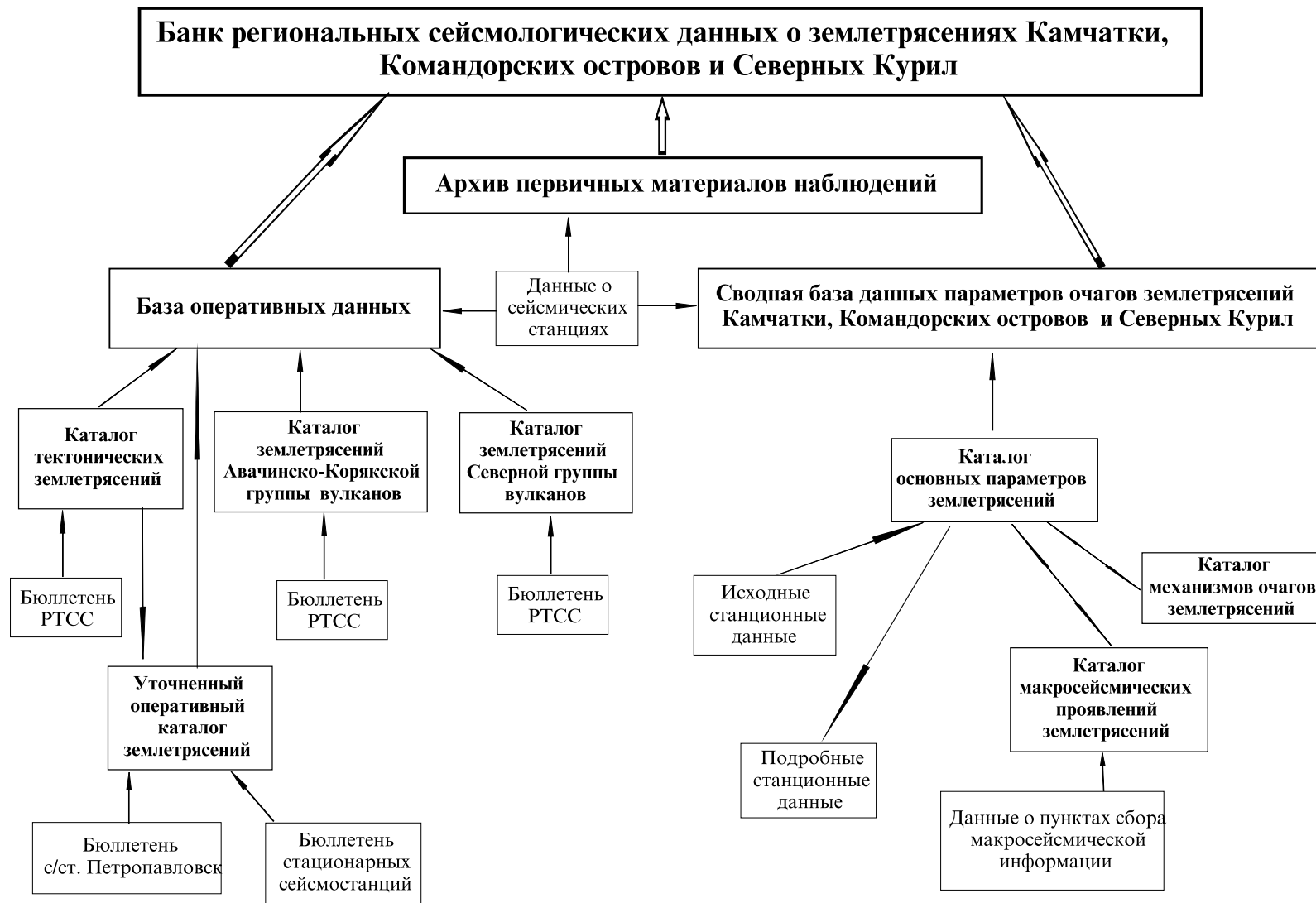
Рис. 3. Структурная схема банка сейсмологических данных КОМСП ГС РАН.